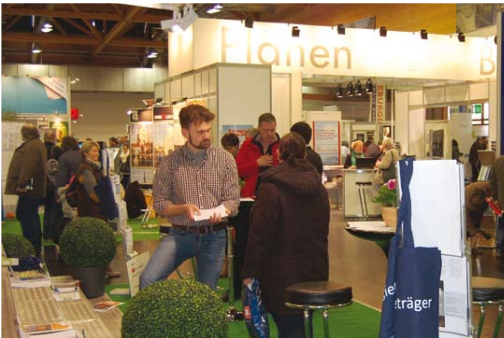
Foto von der LBA

Die Landes-Bau-Ausstellung Sachsen-Anhalt ist am Freitag und Sonntag von 10.00-17.00 Uhr und am Samstag von 10.00-18.00 Uhr geöffnet. Weitere Informationen sind über die Website www.lbabaumesse.de erhältlich.