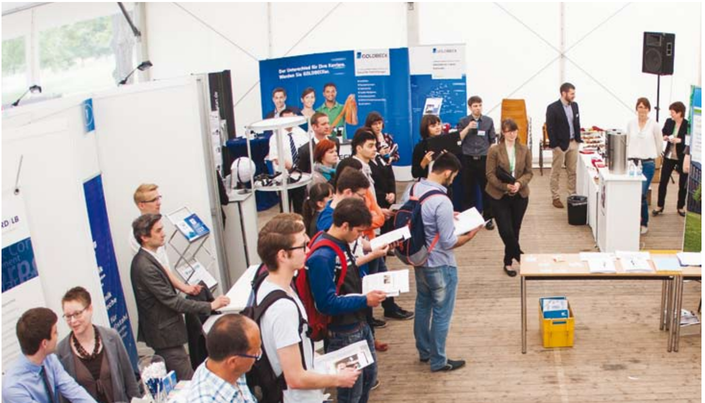
Bild von der Firmenkontaktmesse der Hochschule Magdeburg-Stendal im vergangenen Jahr