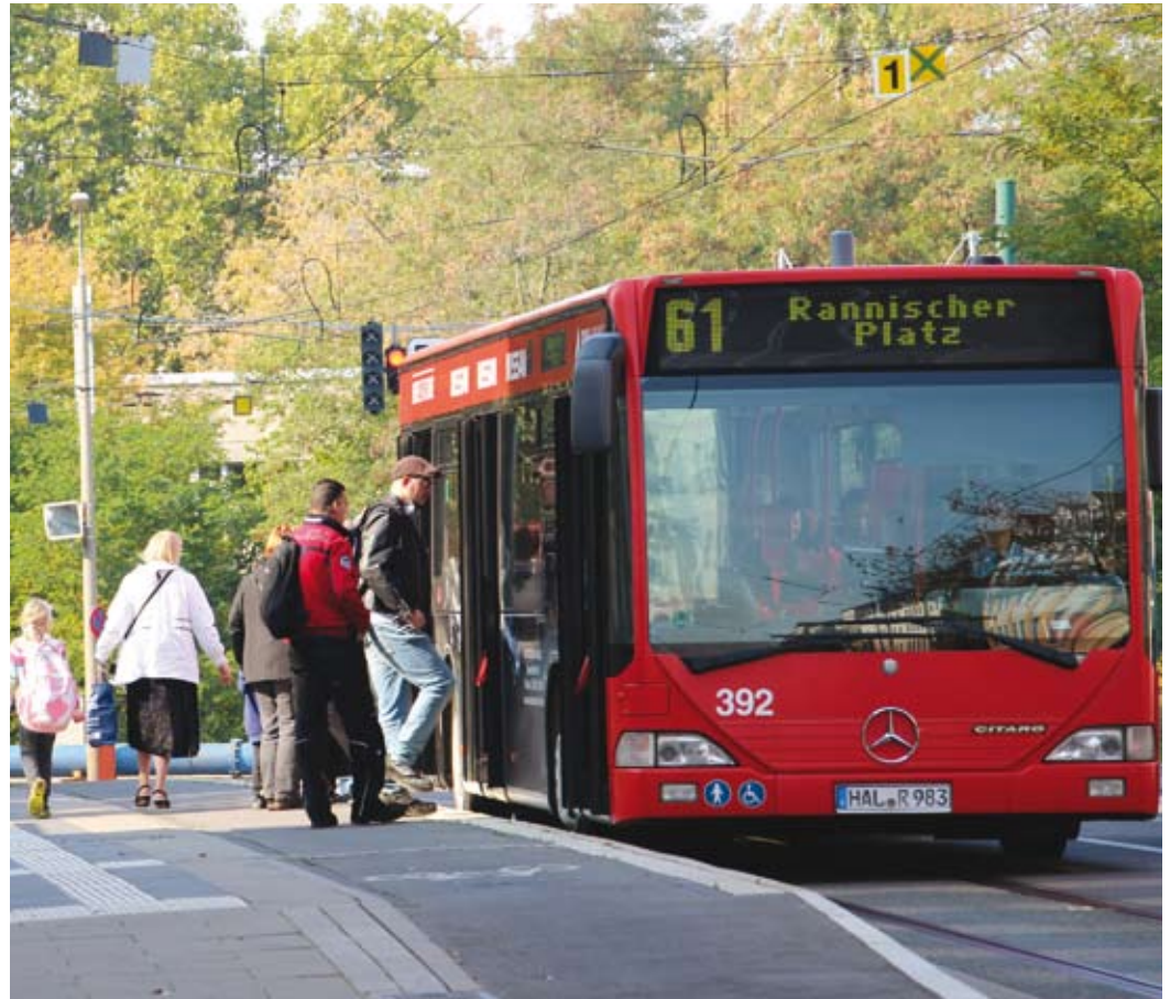
Die Neuerungen sind Teil des Investitionsprogramms „Stadtbahn“, mit dem der Öffentliche Nahverkehr attraktiver gemacht werden soll.

saniert. Die Kosten dafür lagen bei 4,36 Millionen Euro. Davon flossen allein 2,38 Millionen Euro aus dem EFRE. Über den EFRE können unter anderen Vorhaben unterstützt werden, die die Attraktivität der Städte stärken, Barrierefreiheit herstellen oder dazu beitragen, dass CO 2 -Emissionen reduziert werden. An der Torstraße wurden auch die Bordsteine stellenweise abgesenkt und die anliegende Haltestelle Kurt-Tucholsky-Straße wurde auf 45 Metern so umgestaltet, dass die Gäste bequem in Bus und Bahn einsteigen können. Es gibt nun ein Blindenleitsystem sowie akustische Informationen zum Bahnverkehr. Ein neuer Unterstand schützt die Wartenden bei schlechtem Wetter. „Je schneller und bequemer man mit der Bahn unterwegs ist, umso besser wird sie von den Leuten angenommen. Der Umstieg auf den öffentlichen Nahverkehr wiederum sowie das geringere Verkehrsaufkommen bei den Autos nutzt der ganzen Stadt und auch der Umwelt“, so Sterzing. www.havag.com