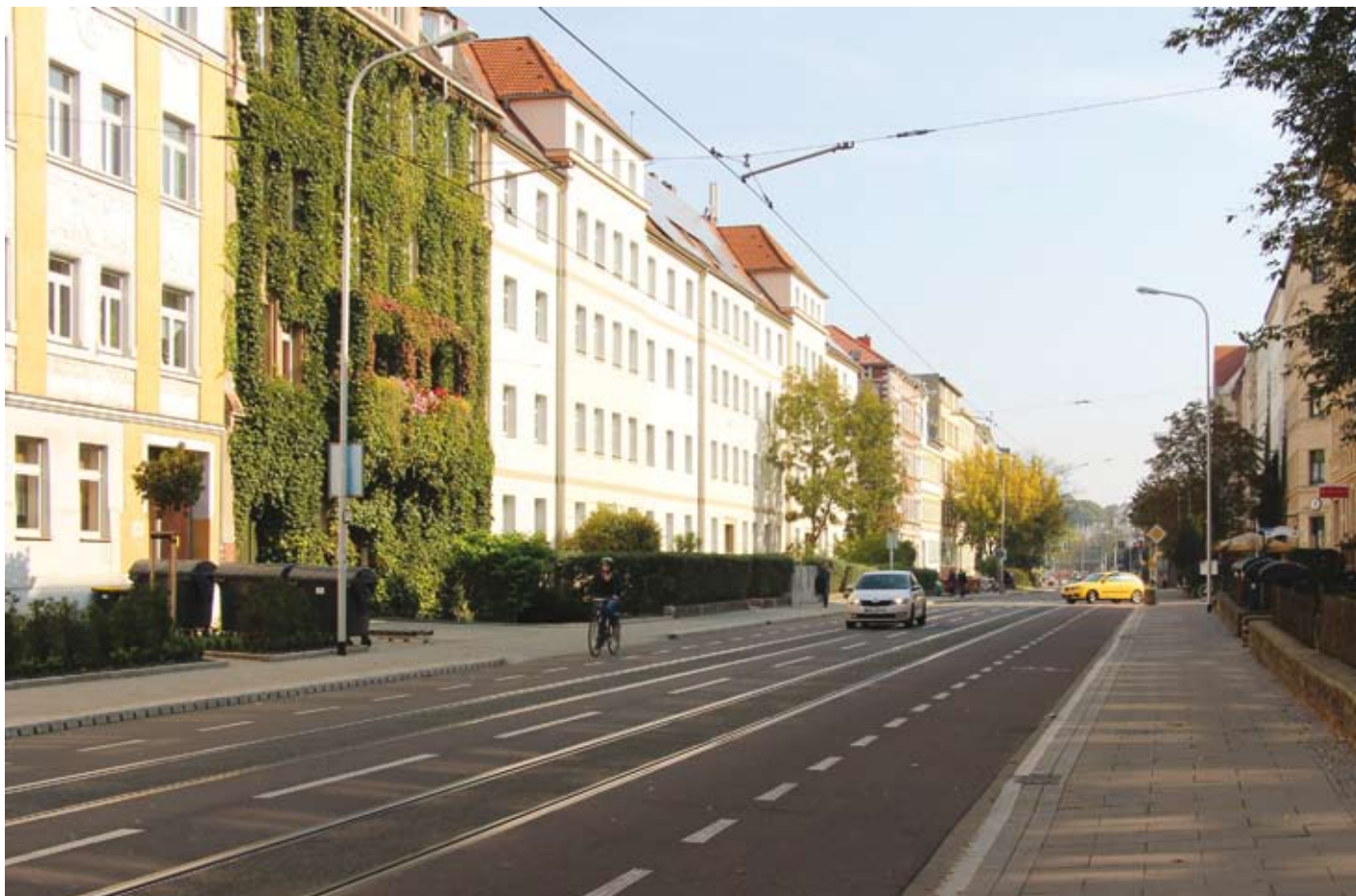
Die Torstraße in Halle wurde komplett erneuert.

Auf der Liste standen Entwässerungsanlagen, Datenkabel, Beleuchtung, Strom- und Kommunikationsanlagen für die Bahn wie auch das Versorgungsnetz für Trinkwasser und Energie. Zudem wurden die Abwasserkanäle und teilweise auch die Gasleitungen