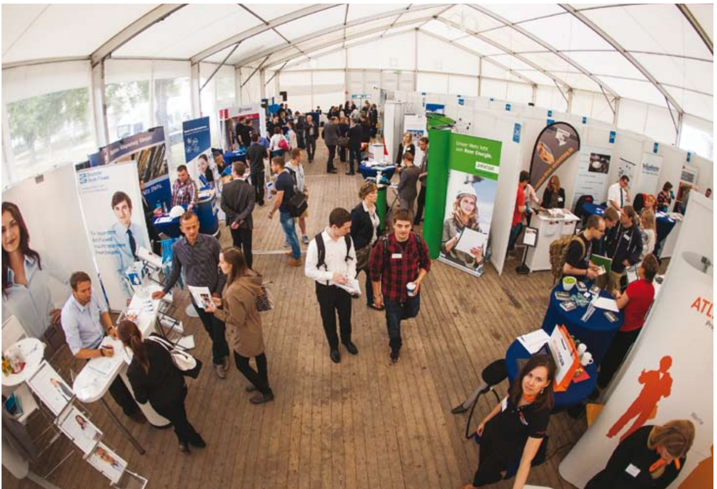
Bild von der Firmenkontaktmesse 2015