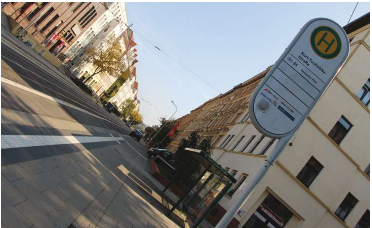
„Alles auf einen Streich“ heißt das Motto: Bei den Baumaßnahmen werden gleichzeitig Versorgungsleitungen und anderes saniert.