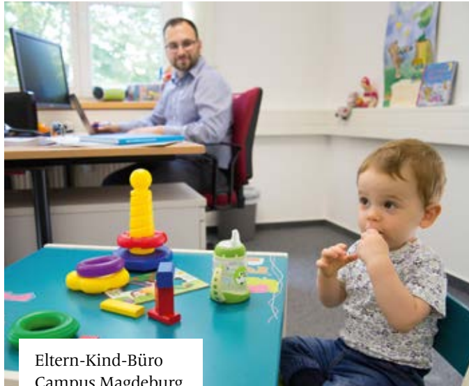
Eltern-Kind-Büro Campus Magdeburg

Damit das Studium vom ersten Tag an gelingt, stehen euch Mentorinnen und Mentoren sowie zentrale Anlaufstellen wie der Familienservice jederzeit bei Fragen zur Seite.