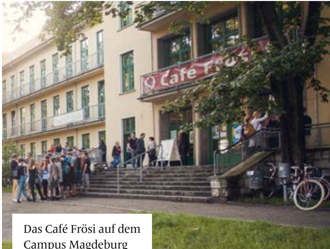
Das Café Frösi auf dem Campus Magdeburg

Hausarbeit schreiben – mach ich später. Neben Netflix, Instagram und Co. bietet der Campus einige Alternativen, um ein wenig zu procrastinieren.