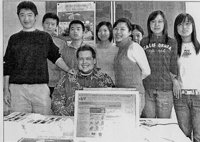
Insgesamt drei Projektgruppen wollen bis zum Ende September Sachspenden über Ebay zu Geld machen.

Einen Namen beim bekannten Auktionshaus haben die Studenten noch nicht gefunden, doch wahrscheinlich entscheiden sie sich für den Namen „hoersaele_fuer_sdl“. Bis zum 30. September, also dem Ende der Semesterferien, soll die Aktion noch laufen. Ehrgeiziges Ziel für Tamir & Co: 100 000 Euro. Selbst 10 000 Euro wären schon toll, damit es vorangeht.